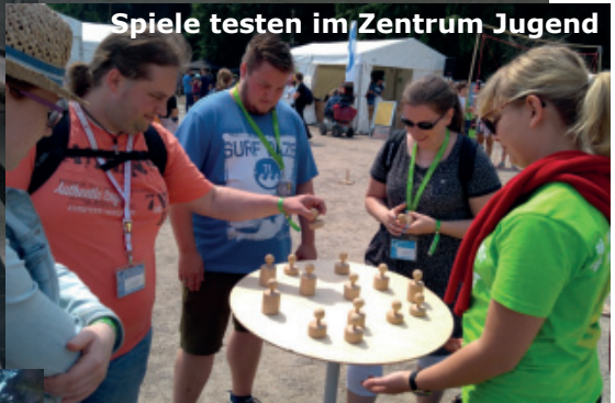
Spiele testen im Zentrum Jugend