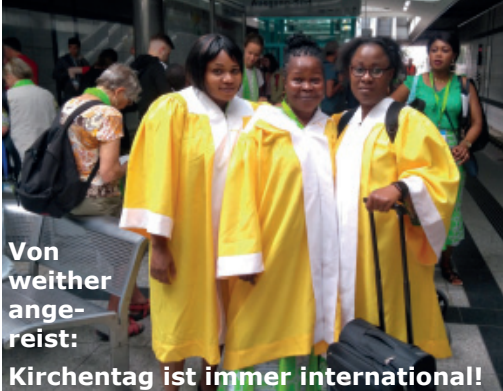
Von weither ange- reist: Kirchentag ist immer international!