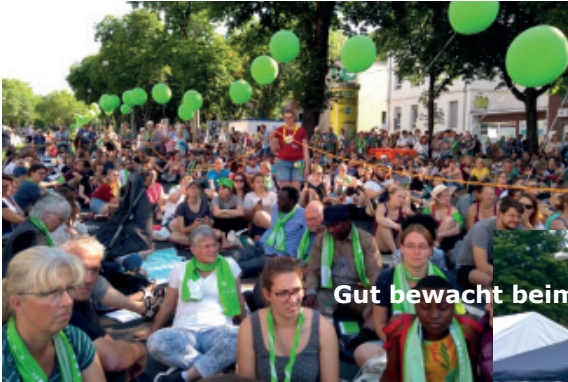
Gut bewacht beim Eröffnungsgottesdienst

Eröffnungs- und Schlussgottesdienst wurden im Fernsehen übertragen - und auch sonst gab es mancherlei Berichte, z. B. in den Nachrichten. Vor allem, wenn Persönlichkeiten wie der Bundespräsident oder die Kanzlerin zu sehen waren. Aber die Eindrücke waren wie immer ungleich vielfältiger. Hier ein kleiner Ausschnitt: