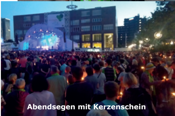
Abendsegens mit Kerzenschein