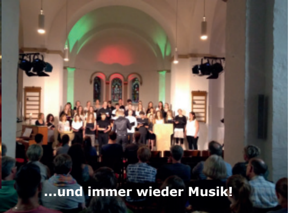
...und immer wieder Musik!