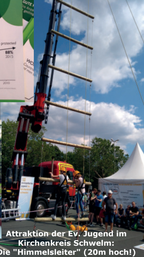
Attraktion der Ev. Jugend im Kirchenkreis Schwelm: Die "Himmelsleiter" (20m hoch!)