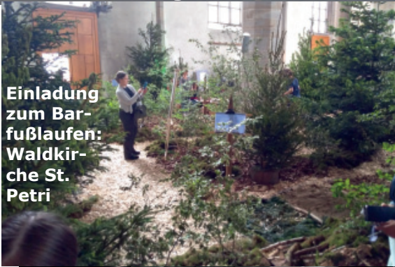
Einladung zum Bar- fußlaufen: Waldkir- che St. Petri