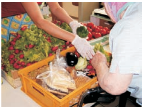
Warenkorb des Schwelmer Tafelladens

(Auszug aus: Grundsatzposition des Westfälischen Herbergsverbandes e.V. , Fachverband der Wohnungslosenhilfe in Westfalen und Lippe)